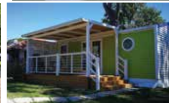
Mobile Home DALIA