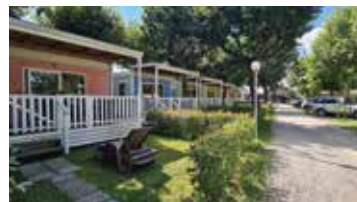
Mobile Home ARCOBALENO