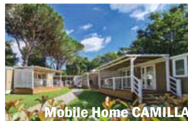
Mobile Home CAMILLA