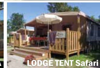
LODGE TENT Safari