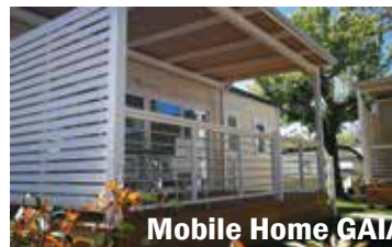
Mobile Home GAIA